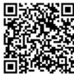
新北校園通_操作說明（家長版）