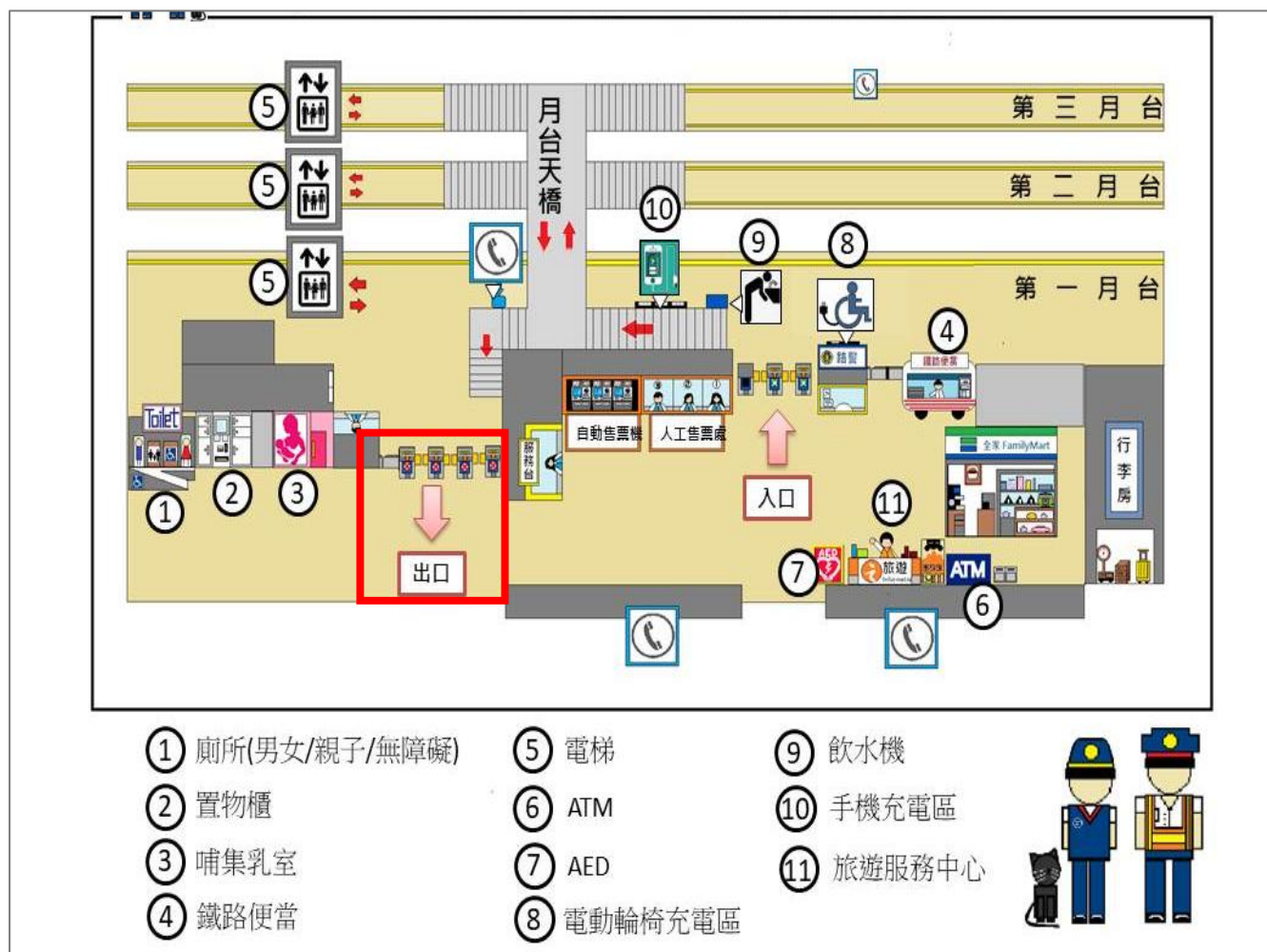
彰化台鐵接駁地點示意圖