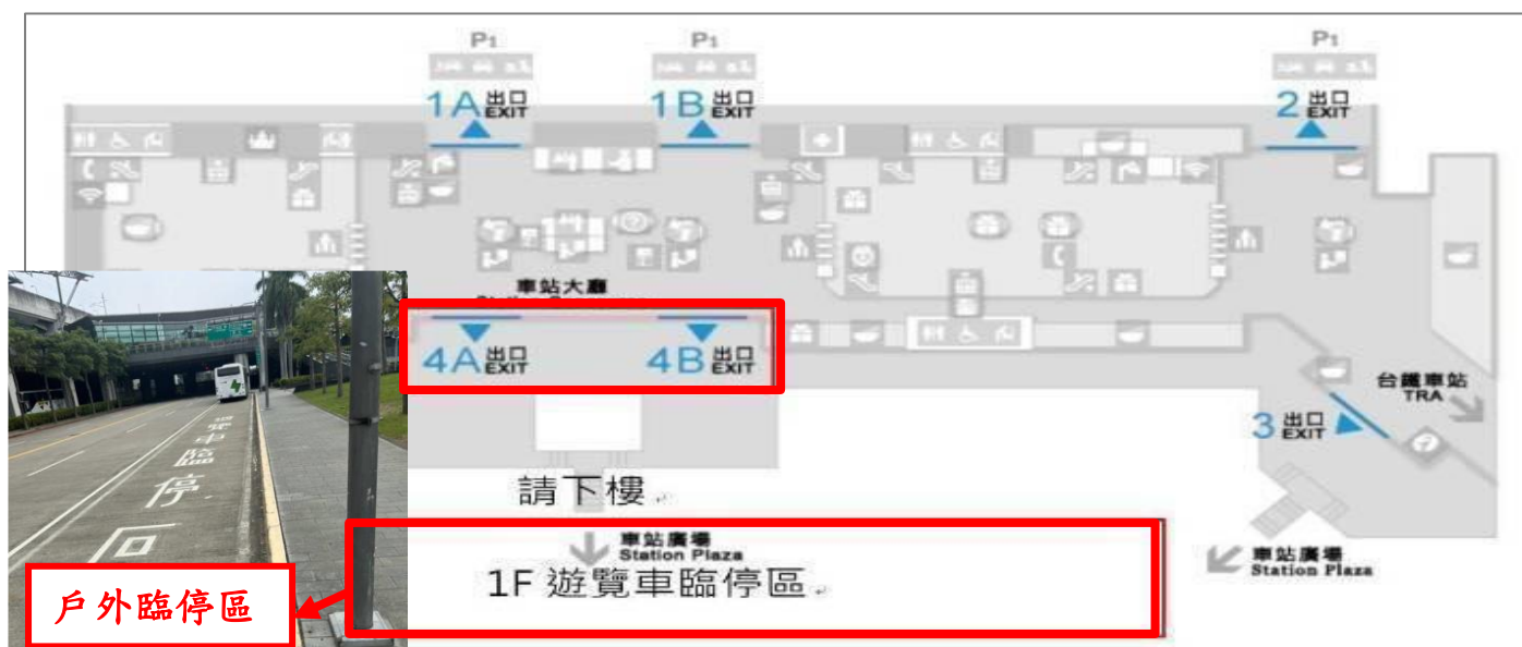
臺中高鐵接駁地點示意圖