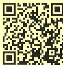
幼兒園校網 QR CODE